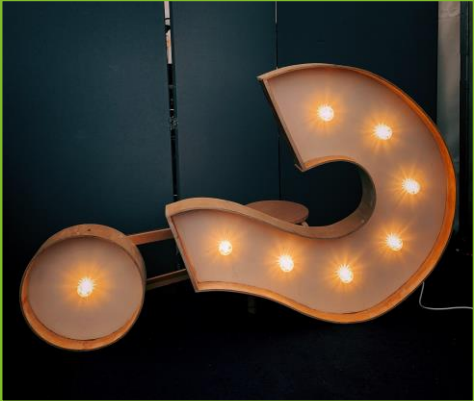
Frag mich alles!

Stehe deinen Kolleg:innen in zwanglosen Fragerunden zu deinem Thema zur Verfügung.