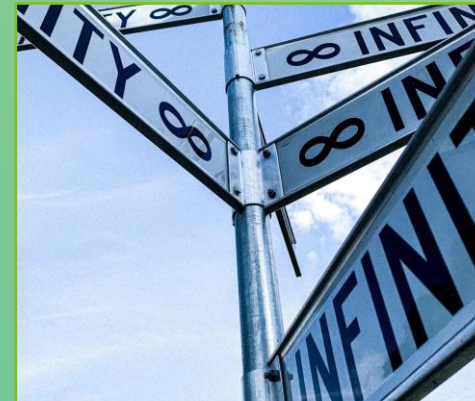
Hier geht's lang!

Zeige deinen Kolleg:innen ganz konkret deine Best Practices oder leite sie vielleicht sogar an.