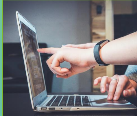
Meine Best Practices!

Zeige deinen Kolleg:innen ganz konkret deine Best Practices oder leite sie vielleicht sogar an.